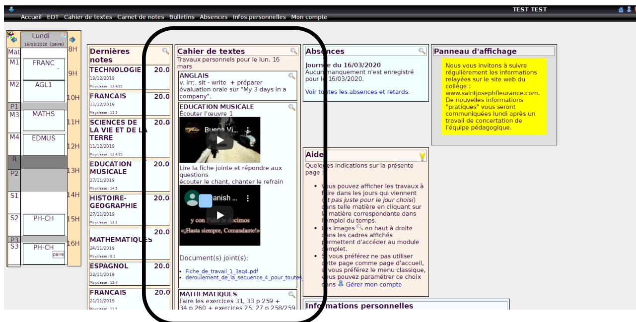
Zone cahier de textes

C'est le cahier de textes qui permettra ici le suivi du travail : séances de cours (fond vert) et travail à effectuer (fond rose). Des documents sont parfois joints, et peuvent être ouverts directement par un double-clic.